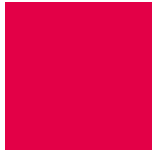
ROJO Ral 3020 6709