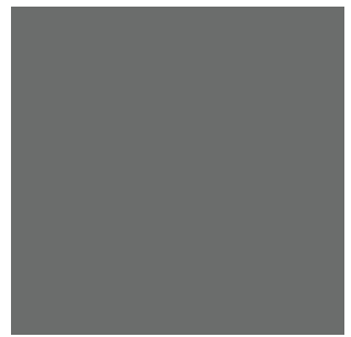
GRIS OSC. Ral 7037 6704